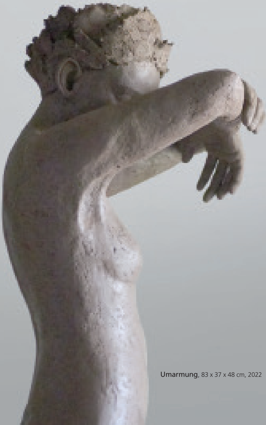
Umarmung, 83 x 37 x 48 cm, 2022