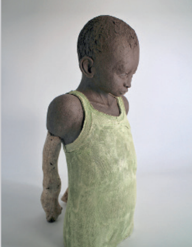
Migrationshintergrund , 58 x 31 x 37 cm, 2023